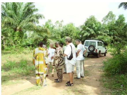
Lieu de construction d'un orphelinat. Projet GREF, financé par le Conseil général du 93.