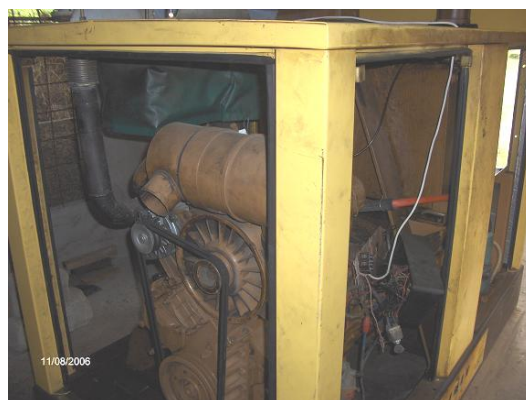
L'électricité photovoltaïque n'est pas bien traitée. De même que le groupe électrogène entretenu par un soi disant technicien béninois. Voir le câblage arraché.