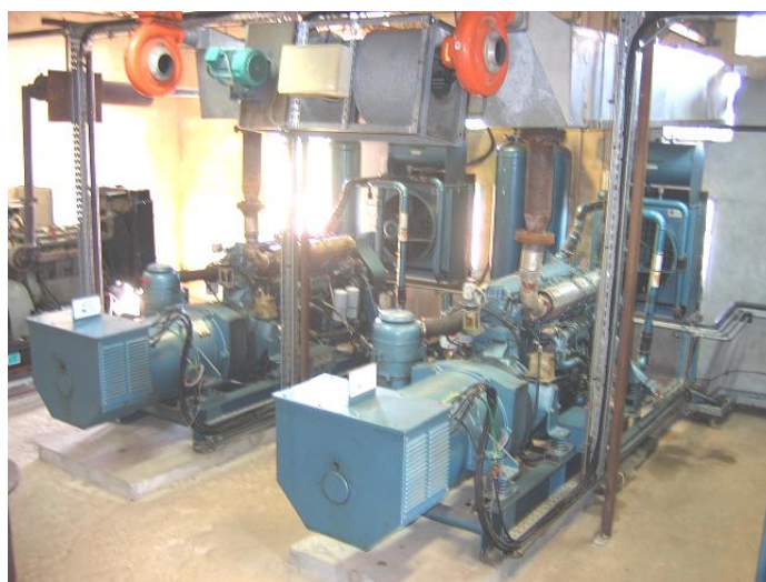
La salle des machines terminée.