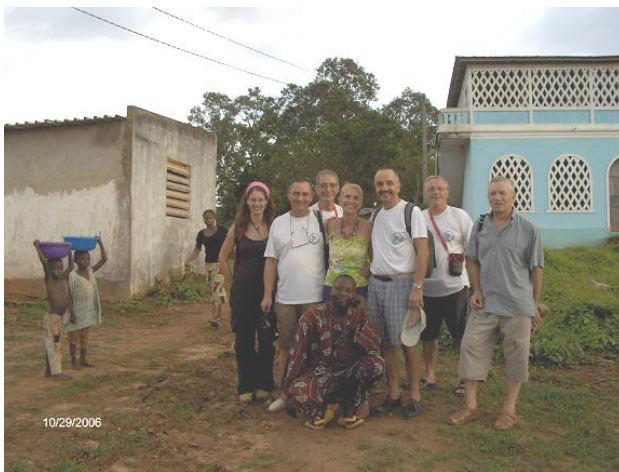
Les amis d'ASF