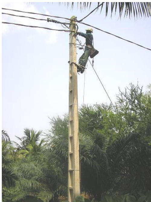
Christophe, un employé SONGHAÏ formé.