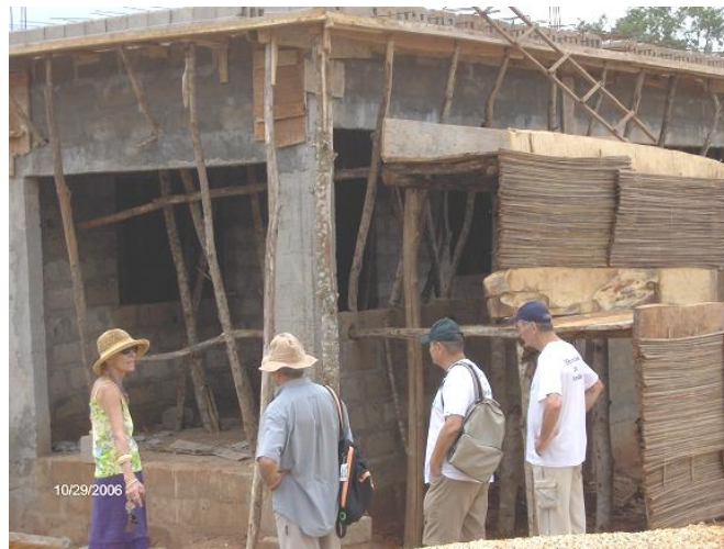
Construction du centre de soins d'Amours Sans Frontière.